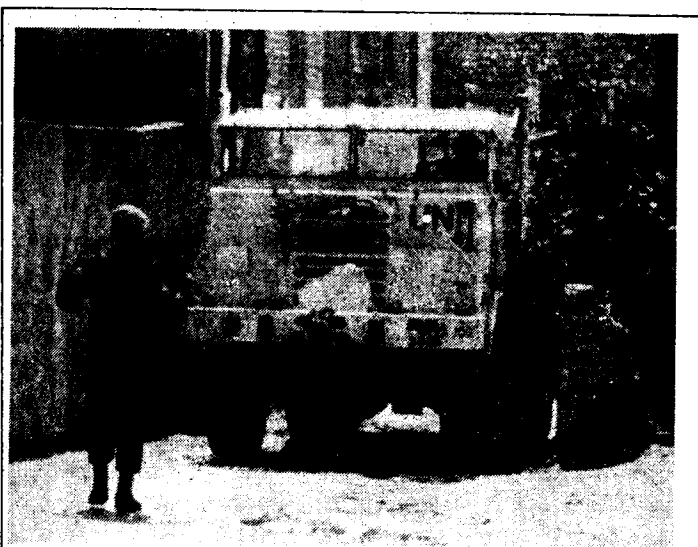
Moeizaam manoeuvrerend door de nauwe straatjes van Haris. Achter het stuur Korporaal Hagen, op weg naar de Voorlichting om het lang verwachte aggre-gaat te brengen.