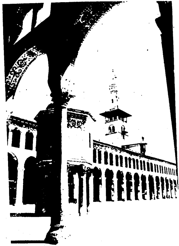
De Omayyade moskee

Enkele attracties in Damascus, een stad van ruim vierduizend jaar oud, zijn onder andere de Souk Hamidiyeh, de Omayyade moskee, het