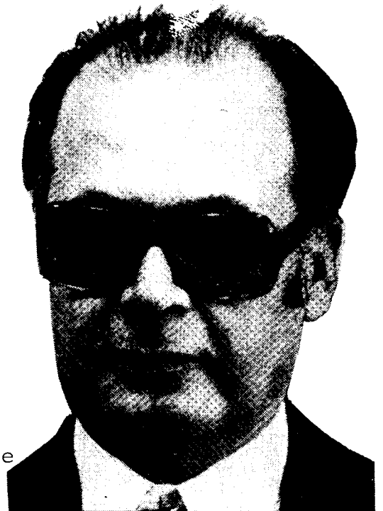
Premier El Hoss

( zie ook : Enige achtergronden... bij de Incidentenlijst)