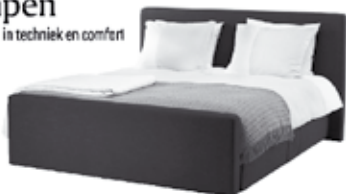
Model Mandraan, boxspring in fraaie 'strakke' stelling. Vlak of elektrisch verstelbaar.