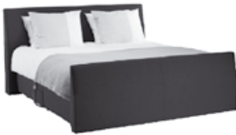
Model Van Gogh, boxspring met afgeschuifd hoofd- en voetbord. Vlak of elektrisch verstelbaar.